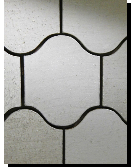
表面のツヤ感、色ムラ感等タイル1枚1枚の表情が違いますが、全体では、調和のとれた豊かな表情になります。