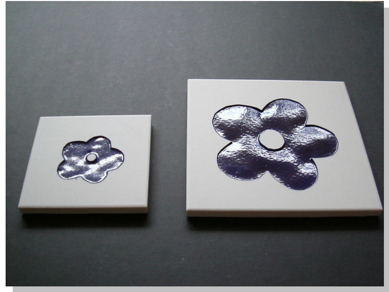
斜めから見たイメージ

材質:磁器質施釉品【ブラスト加工+上絵製法ータイル種類はベースタイルによります。】