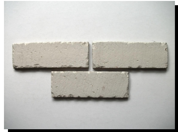
ハツリ部分を施釉したタイプ