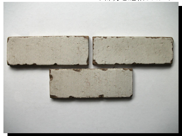
ハツリ部分を生地のままタイプ