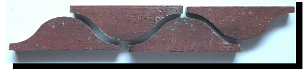
【上】ホワイト施釉タイプ【下】素焼きタイプ