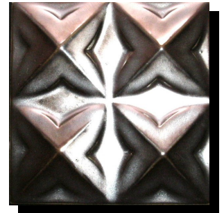
特注 103mm 角特面 Bronze