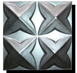
特注 103mm 角特面 Silver