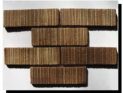
個々のタイルにムラがあります。