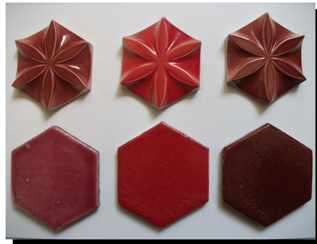
ブラウン・レッド